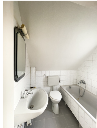
Zweites Bad mit Wanne