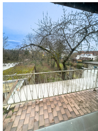
Grundstück mit viel Platz