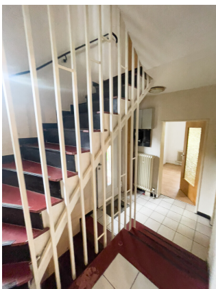
Ihr Besichtigungstermin wartet