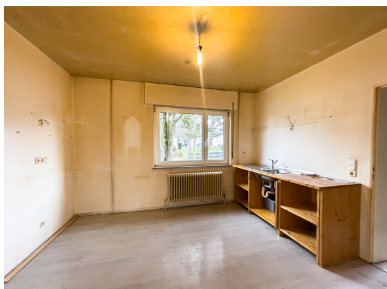
Bereit für Ihre Ideen