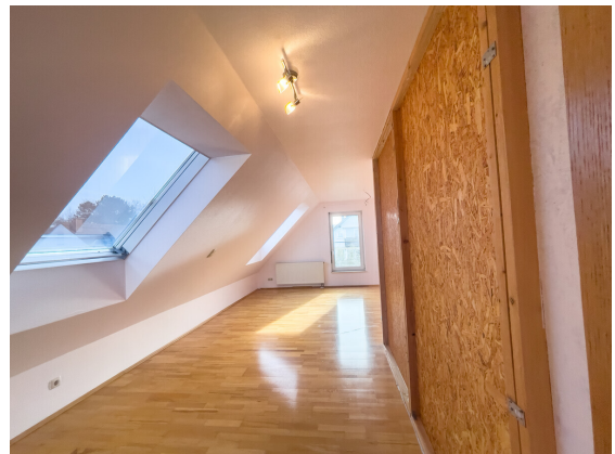
Home-Office oder Jugendbereich