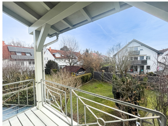
Balkon und Terrasse