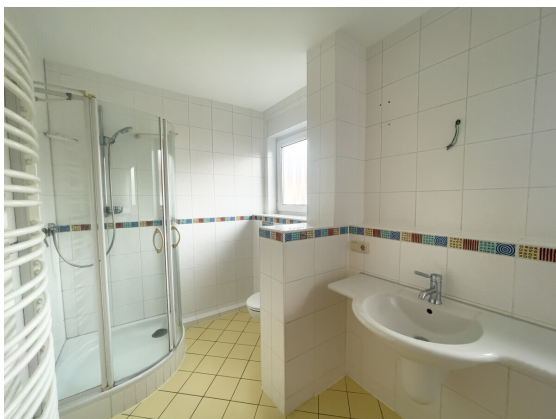
Dusche und Wanne