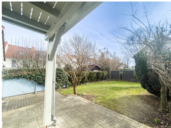
Platz an der Sonne