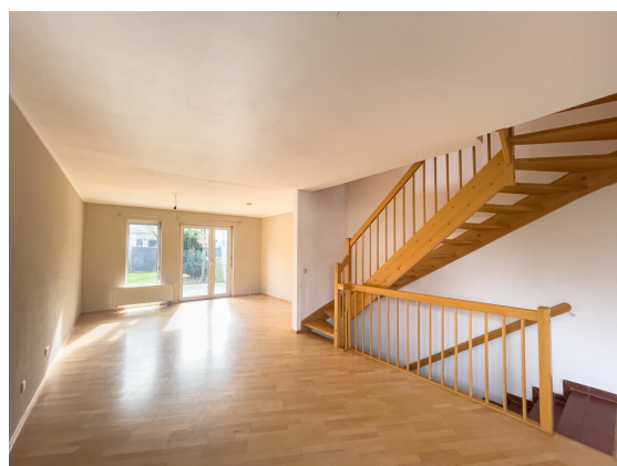
Hell und freundlich