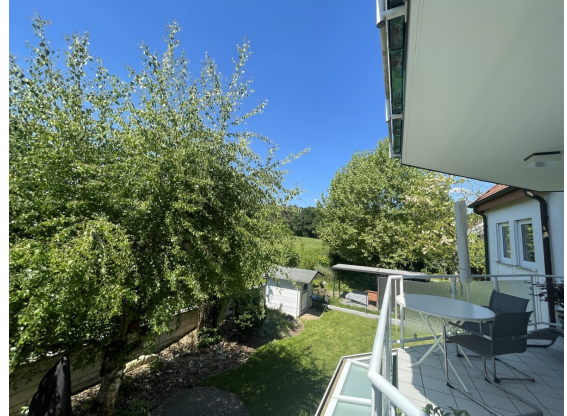
Urlaub auf Balkonen