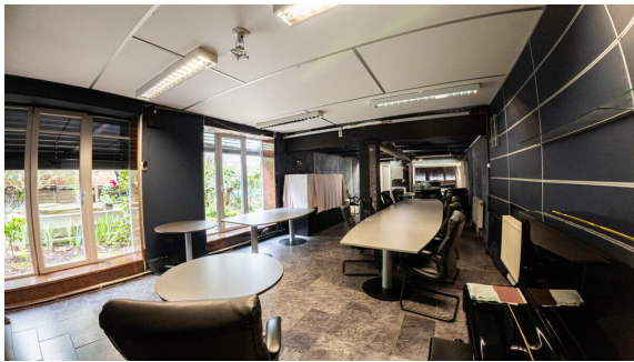
Wohnen und Arbeiten unter einem Dach