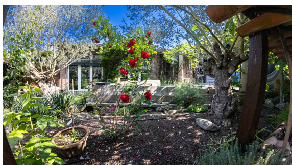
Nutz- oder Ziergarten_