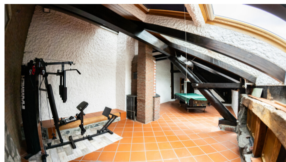
Hobby- oder Wohnzimmer