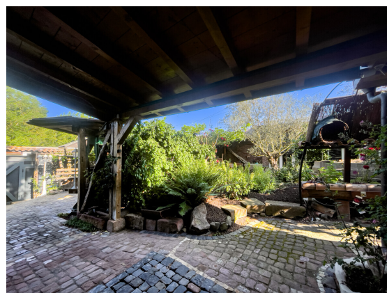
Garage und Carport