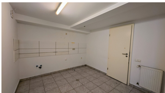
Ihr Projekt wartet