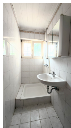
Es gibt was zu tun