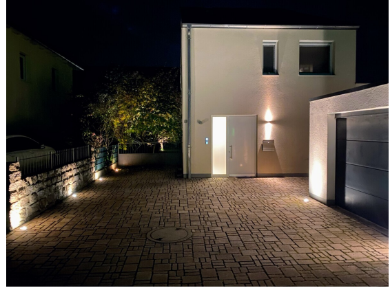
Rund um die Uhr ein Blickfang