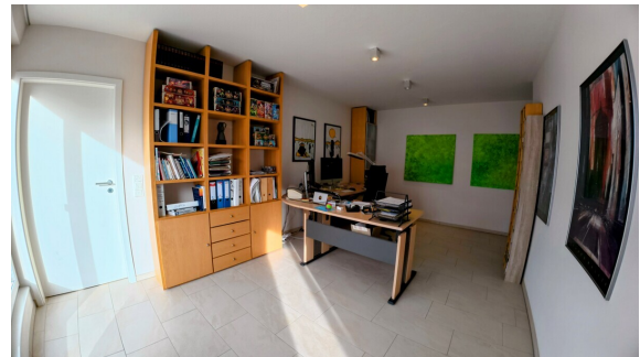
So macht Arbeiten Spaß