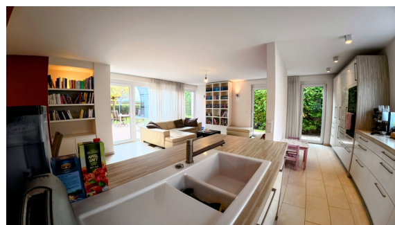
Hell und freundlich