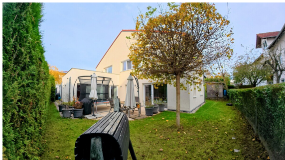
Spiel und Spaß