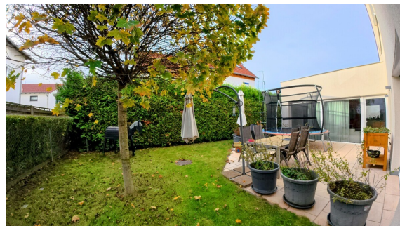
Entspannen im Grünen