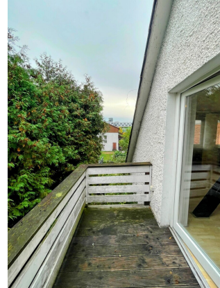
Den Feierabend genießen