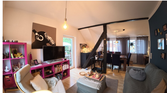
Eine Investition die sich lohnt